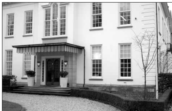
De ingang van het huis Oud Bussem. Rechts op de hoek van de gevel de steen.