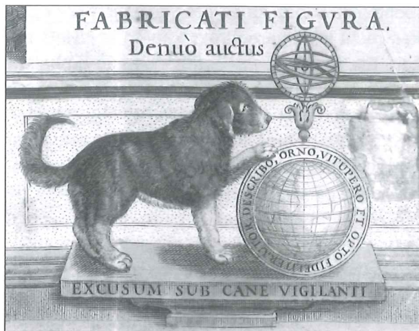
Drukkersmerk van de firma Hondius ('De Wackere Hond').

van buiten. 20 De schout moest laveren tussen de verwachtingen van de baljuw en de wensen van de dorpelingen. Niet elke schout was daar even behendig in. Het gevolg was dat er nogal eens conflicten ontstonden tussen de schout en de inwoners van het dorp. Met name de schepenen, de 'mensen van binnen', konden stevig botsen met de schout, de buitenstaander.