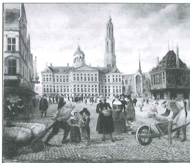
De Dam in Amsterdam, met links het pand 'De Wackere Hond', geschilderd door een onbekende schilder.

De brief van Hondius wekt de indruk dat het in dit conflict om de persoon van Claes de Swart