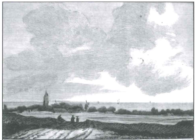
Gezicht op Huizen vanaf de Tafelberg, 1739, ingekleurde ets van Hendrik Spilman.

De schout was eerder de plaatselijke zetbaas van het landsbestuur dan een belangenvertegenwoordiger van de dorpsbewoners. De baljuw benoemde dan ook bij voorkeur iemand