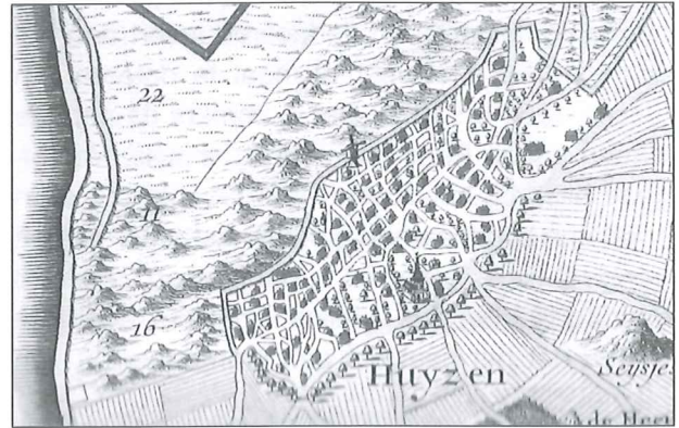
Huizen op de kaart van Ottens (circa 1730).

De meeste inwoners van het Gooi waren na de Reformatie katholiek gebleven, maar in Huizen lag dat anders. Daar bezochten de meeste dorplingen in 1644 de Gereformeerde Kerk. De invloed van de kerk op het dorpsleven was veel minder groot dan in de negentiende en twintigste eeuw. Het kostte moeite om de Huizers in het gareel van de kerkelijke tucht (bijvoorbeeld op het punt van de zondagsheiliging) te laten lopen. Lang niet alle Huizers die de diensten bezochten, waren ook lidmaat van de Gereformeerde Kerk: deze laatste groep vormde minder dan de helft van de bevolking. De overigen waren vooral toehoorders. Hondius heeft het in zijn brief over meer dan vierhonderd communicanten en maer