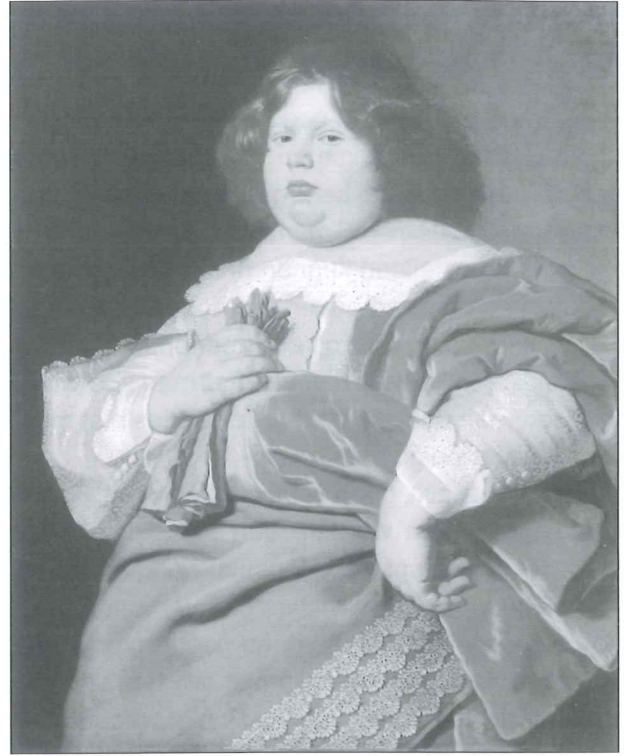
Gerard Andriesz. Bicker, schilderij van Bartholomeus van der Helst (coll. Rijksmuseum).