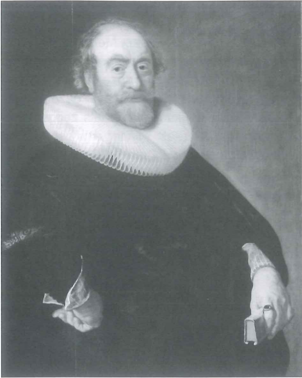
Andries Bicker, schilderij van Bartholomeus van der Helst (coll. Rijksmuseum).